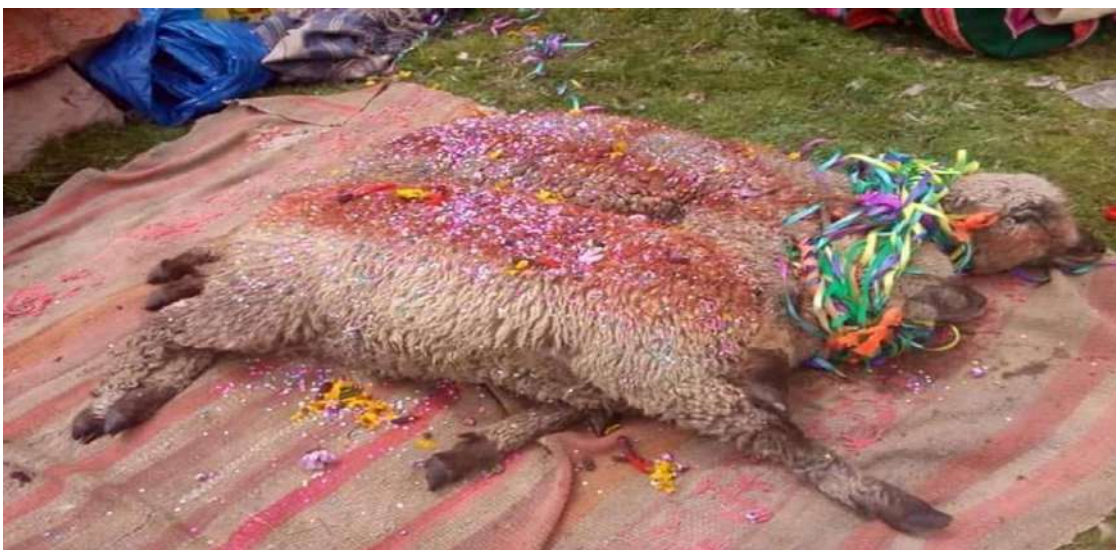
Imagen 1. Ofrenda a la Pachamama en el mes de 24 de junio