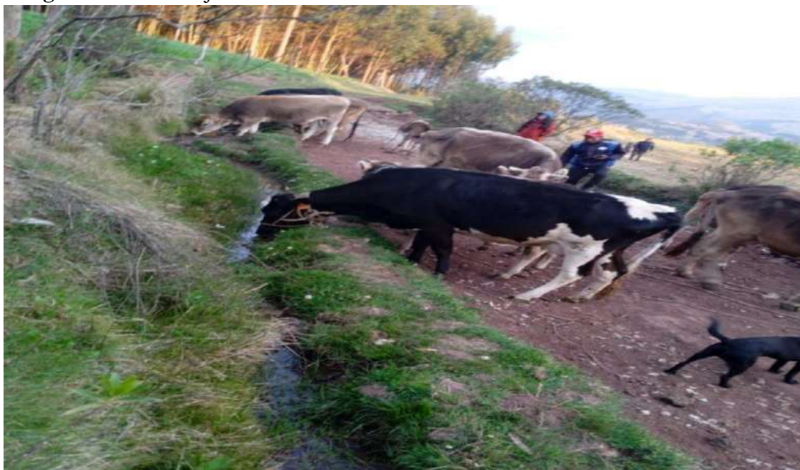
Imagen 16. Vacas mejoradas de las asociaciones de lecheritas