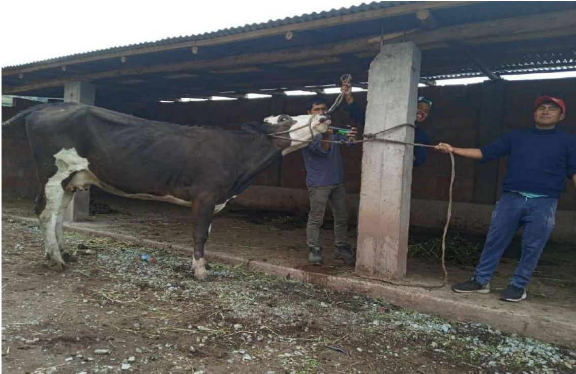
Imagen 11. Sanidad en cuanto al ganado con plantas medicinales curativas