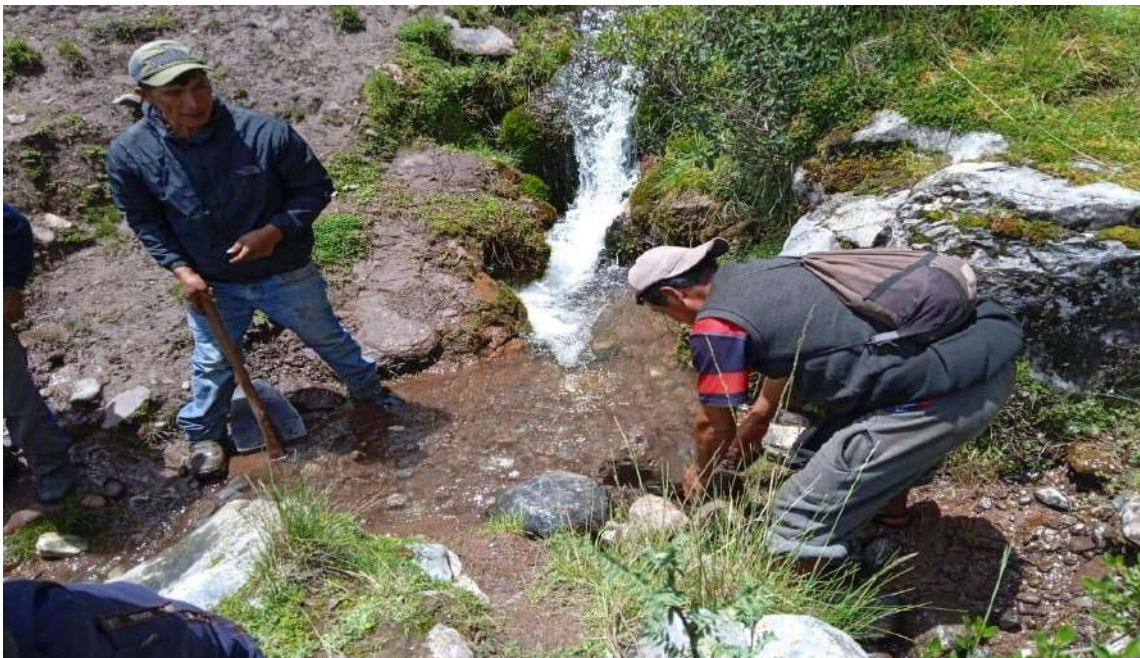
Imagen 12. Permiso para poder hacer faena comunal al Apu soccomarka.