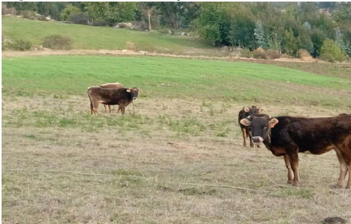
Imagen 15. Vacas criollas comiendo en los pastos naturales de la comunidad