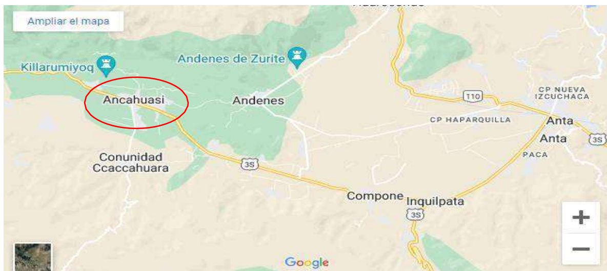
Imagen. Vista panorámica del distrito de Ancahuasi

Desde la ciudad del Cusco, se toma la vía asfaltada Cusco – Anta (Izcuchaca), se encuentra a 47 km. de la Ciudad del Cusco, la vía de acceso es la ruta Cusco – Lima carretera Interoceánica, las unidades móviles que acceden a la Comunidad son buses y autos (con destino a la provincia de Anta, Distrito de Ancahuasi). La ruta es de acceso libre, a unos 40 min de Cusco, donde se debe bajar en el distrito en mención luego coger una moto o taxi para llegar al destino, que antes llamado Lucrepata, en la actualidad San Martin de Porres.