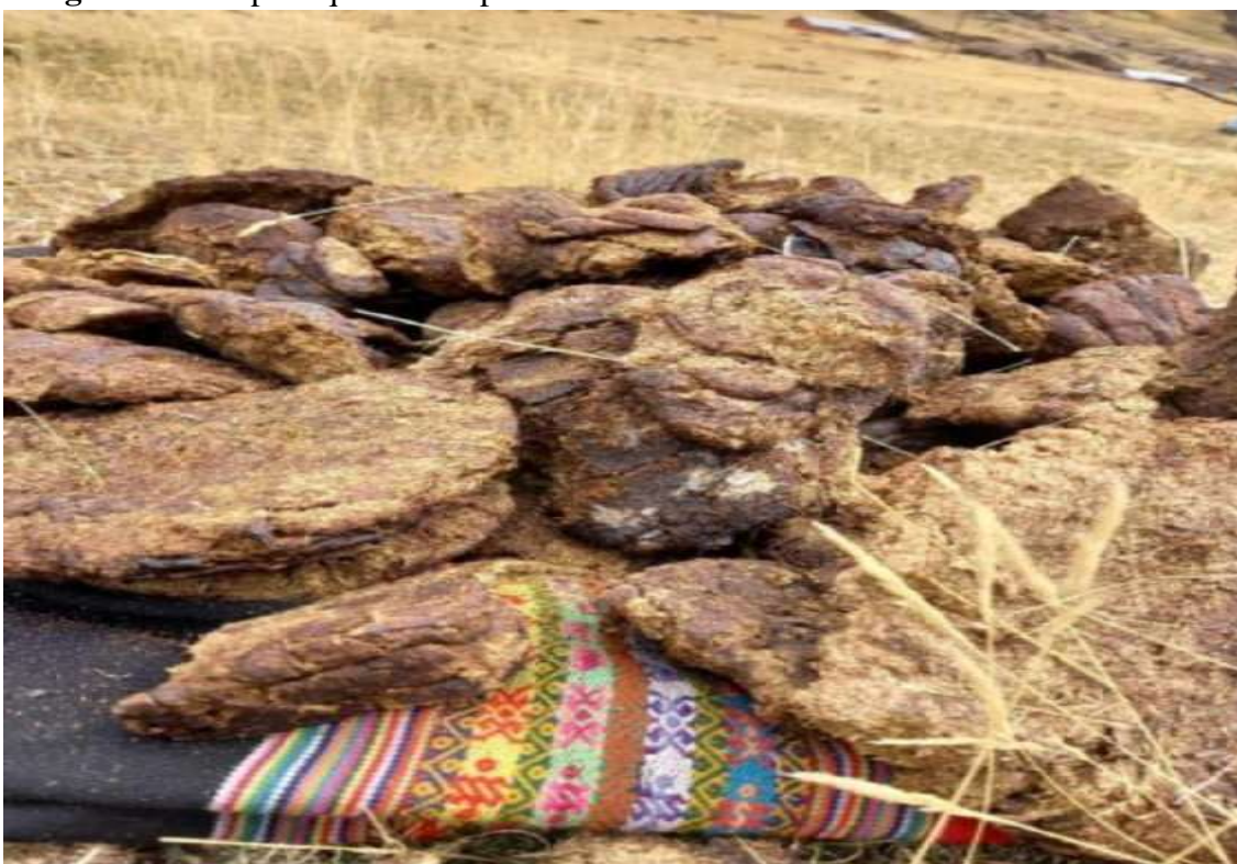
Imagen 2. Bosta para quemar despacho