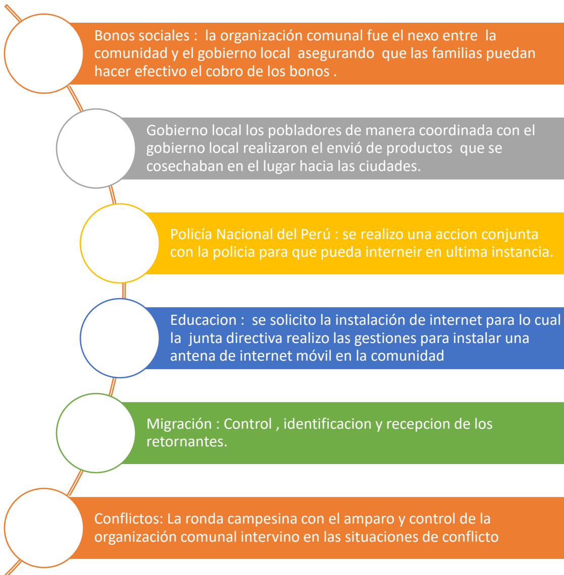
Ilustración 4 Acciones externas