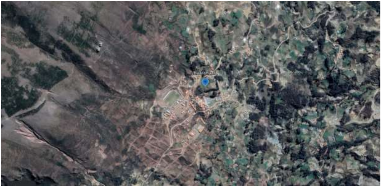
Ilustración 2 Mapa Localización de Huarahuara