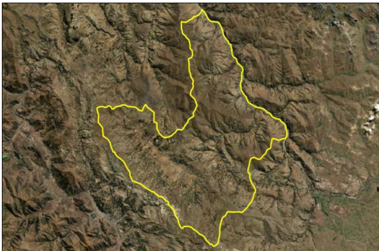
Ilustración 1: Mapa Relieve de Huarahuara