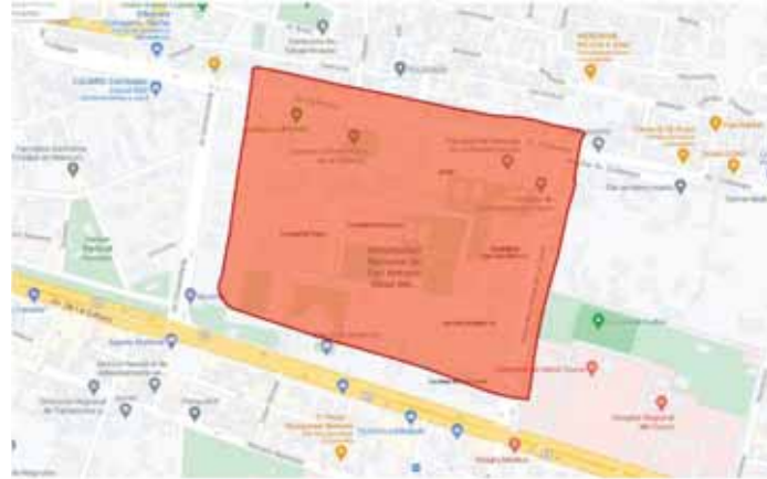
Imagen 2.